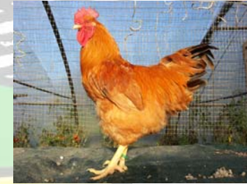
Gallo de Raza Llodiana